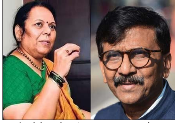
अपमानित केले जायचे. त्यांना मुद्दामहून बाजूला टाकले जायचे. मनोहर जोशींच्या बाबतीत हेच झाले. शिवसेना (ठाकरे गट) पक्षप्रमुख उद्धव ठाकरे आजारी पडल्यानंतर पक्षात काय सुरू आहे, हे कळतच नव्हते. पक्षश्रेष्ठींना हे असलेले संजय राऊत यांच्याकडून बोलून घेतले

त्यानंतर पत्रकारांनी विचारलेल्या प्रश्नांवरही त्यांनी आपली मते व्यक्त केली. बाळासाहेब ठाकरे, उद्धव ठाकरे, आदित्य ठाकरे, एकनाथ शिंदे, मनोहर जोशी, संजय राऊत अशा अनेकांसंदर्भात त्या मोकळेपणाने बोलल्या. प्रत्येक राजकीय नेत्याची शैली वेगळी असते. शिवसेना प्रमुखांची वेगळी होती. त्यावेळी कठोर शिस्त होती. त्यांना बारिक माहिती असायची. आमच्याकडे २०१५ नंतर कार्यपद्धती बदलली. मला एक्सेस होता. मात्र, प्रश्न घेऊन जाणाऱ्या अनेक बड्या नेत्यांना त्याय मिळत नव्हता. नेत्यांना काम करू देत नव्हते.