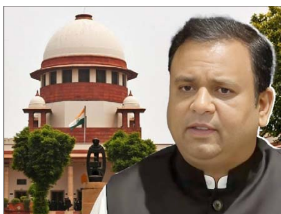
विधिमंडळ या दोन्ही संस्था आपापल्या कार्यक्षेत्र राहून काम करीत आहेत. यात अंतिम शब्द कोणाचा असेल असे होत नाही. त्यामुळे न्यायालयाने ३१ डिसेंबरपर्यंत

असून सुनावणीसाठी अधिक वेळ लागल्यास आणि ३१ डिसेंबर आधी सुनावणी पूर्ण करणे शक्य न झाल्यास सर्वोच्च न्यायालयाकडे वेळ मागितला जाईल, असे विधानसभा अध्यक्ष राहुल नावेंकर यांनी स्पष्ट केले. नागपूर येथील सुयोग पत्रकारांच्या अधिवेशनकालीन निवासस्थानी अनौपचारिक संवादावेळी विधानसभा अध्यक्षांनी सुनावणी विषयी माहिती दिली. न्याय संस्था आणि