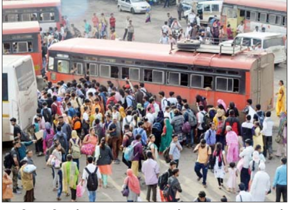
दि. २९ विदर्भ प्रजासत्ताक अमरावती धावपळ करीत बसस्थान गाठायचे. सामान आवरत बसमध्ये चढायचे, त्यातच जागाच मिळत नाही. अशी परिस्थिती नेहमीच

परिवहन महामंडळाची सुविधा : दिवाळीत अनेकांनी घेतला ऑनलाइन आरक्षणाचा लाभ